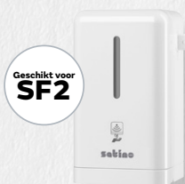
Sensor Mini Clean&Care dispenser