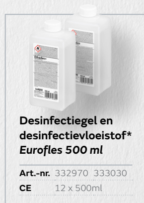
Desinfectiegel en desinfectievloeistof* Eurofles 500 ml