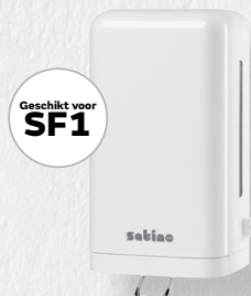
Handmatig Large Clean&Care dispenser