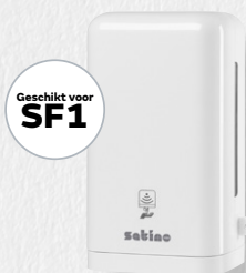
Sensor Large Clean&Care dispenser

Echte allrounders: ze kunnen desgewenst worden gevuld met zeep, desinfectiemiddel of toiletbrilreiner.