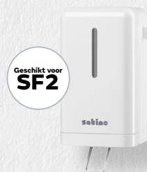
Handmatig Mini Clean&Care dispenser